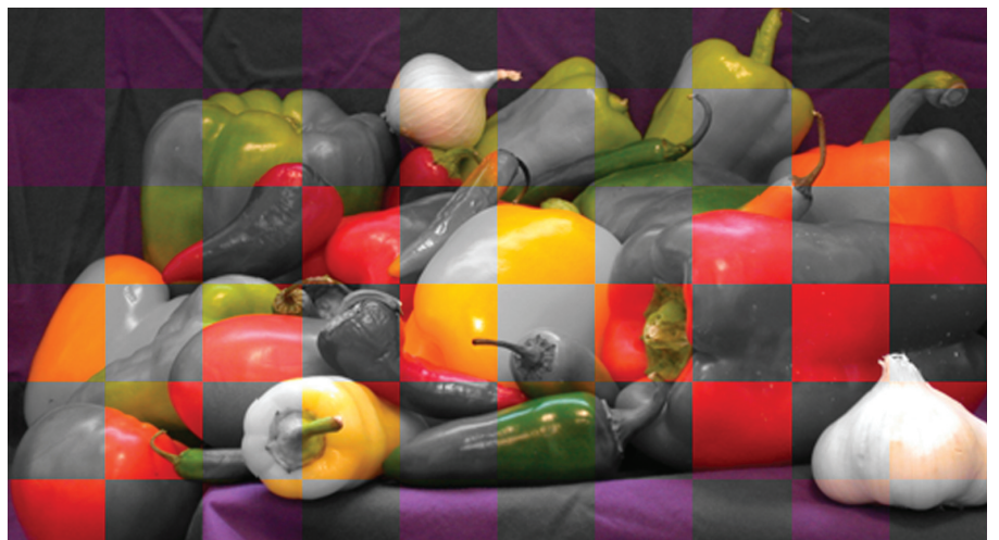
ABB. 2: Das Graustufenbild mit Schachbrett-Transparenzmuster lässt Teile des Farbbildes durchscheinen.