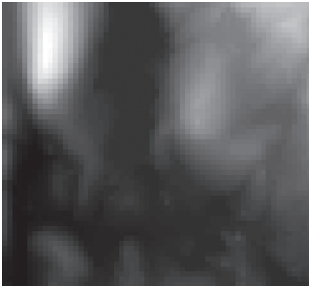
ABB. 3: DHM-Bild von Peppercorn Hill und North Pond, Massachusetts. Helle Pixel entsprechen hochgelegenen Geländepunkten