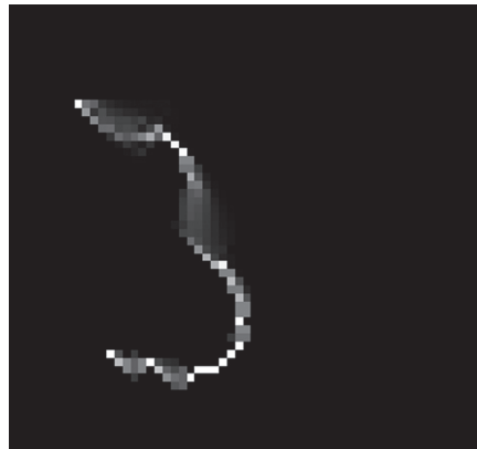
ABB. 4: Die Influence Map macht das bergab fließende Wasser sichtbar.